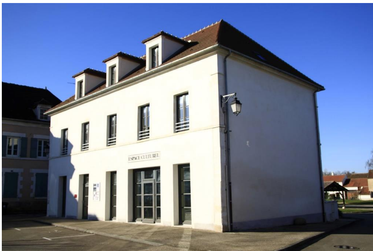
Le bâtiment de l'Espace culturel

Cette année, la municipalité souhaite intégrer dans son programme culturel 2023, un projet de résidence d'artiste « Hors les murs ».