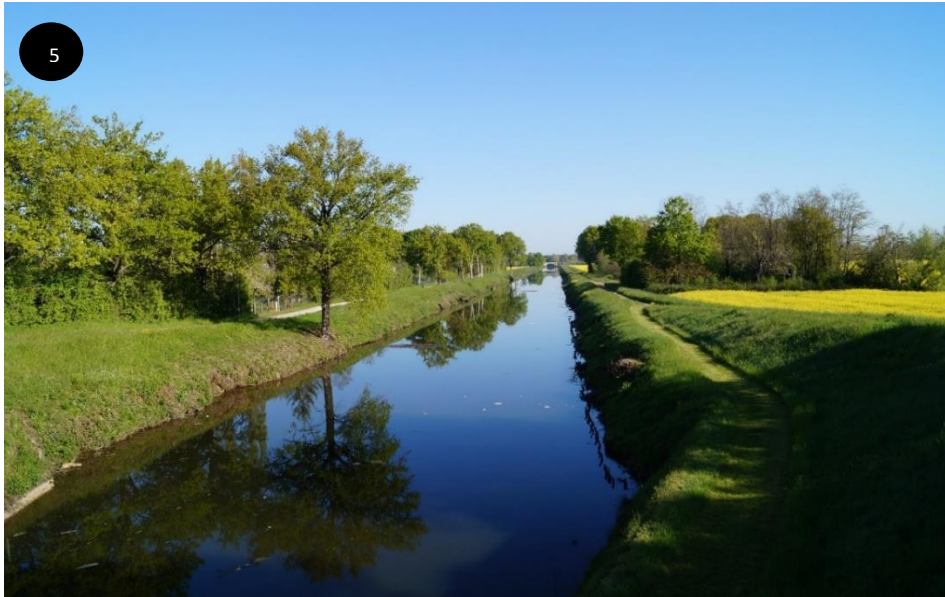
Entrée du canal de dérivation de l'Yonne

L'œuvre ou l'installation bénéficiera d'une visibilité, car elle est située sur le tracé du véloroute et se situe à proximité d'emplacements stratégiques : proche de la place de rivière (lieu de manifestations, en période estivale) et traversée par l'Escale (aire d'accueil pour camping-cars et halte fluviale pour bateaux de plaisance).